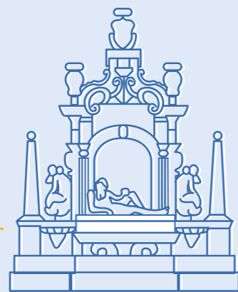
FONTANA DEL SEBETO