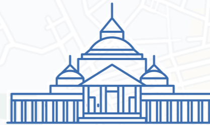
PIAZZA DEL PLEBISCITO